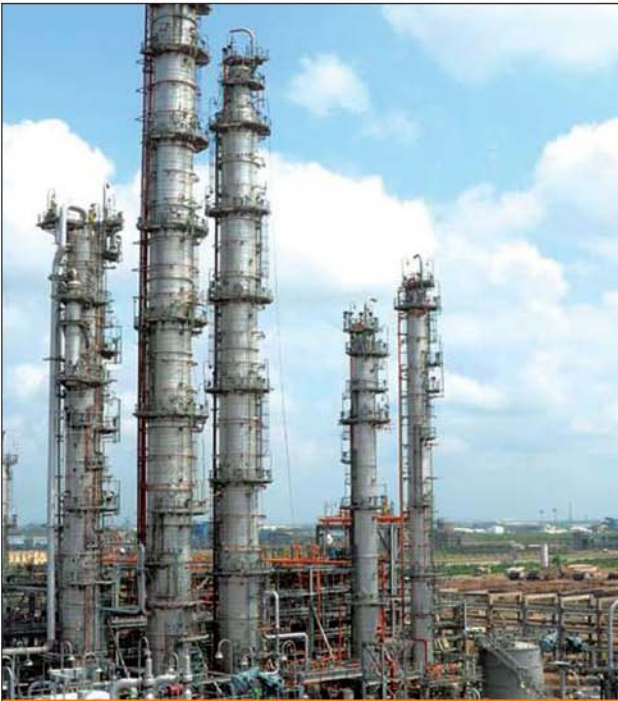
पीसीपीआईआर दहेज, गुजरात PCPIR Dahej, Gujrat